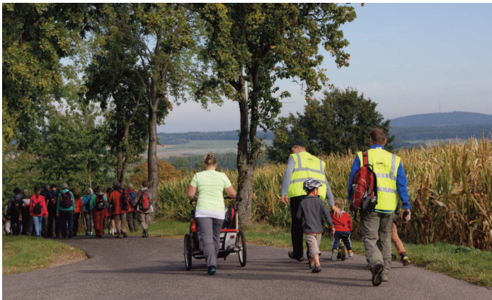
Auf dem Wachtberg zwischen Kemmlitz und Glossen (A. Lobe)

Von Seiten des Heimatvereins wurde noch einmal auf die bestehenden Hygieneregeln hingewiesen, welche ausnahmslos eingehalten wurden. Sehr positiv wurde von den Anreisenden aufgenommen, dass die Toilettenanlage im Geoportal genutzt werden konnte, welches extra eher öffnete. Im kommenden Jahr wird es sicherlich eine separate Bahnhofstoilette geben!