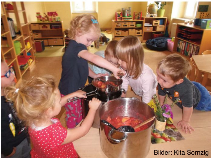
Bilder: Kita Sornzig