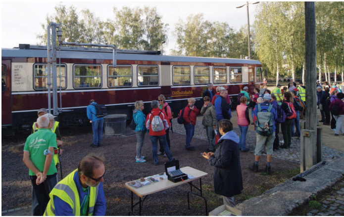
Ankunft des Triebwagens aus Oschatz (A. Lobe)